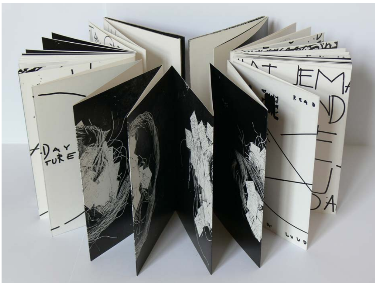
K. Pacovská, Berlinmix 1