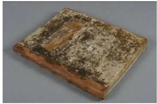
Stav po restaurování