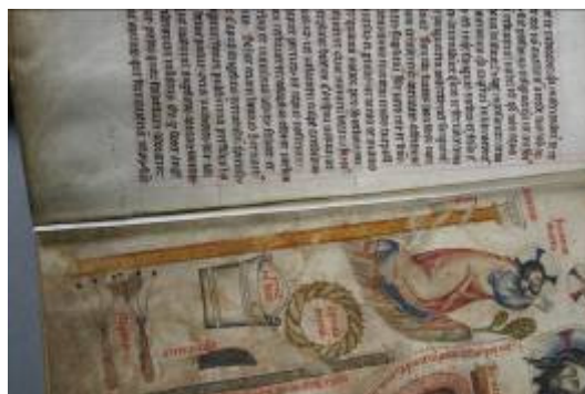
Výsledné křídélko v místě chybějícího folia