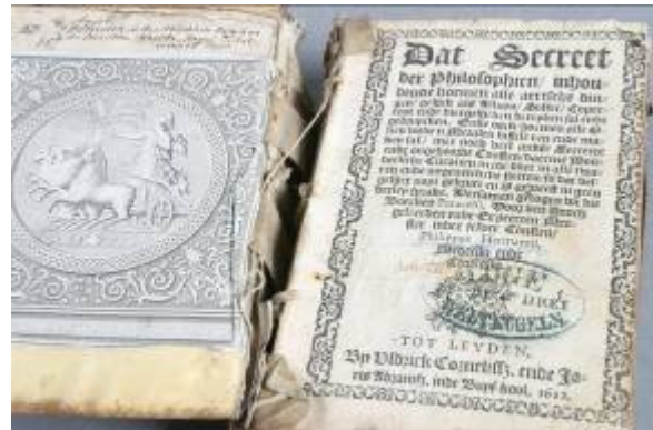
Utržená přední deska s ex libris

Knižní blok byl očištěn a spraven. Desky a potah byly sejmuty. Z předeštlí byla sejmuta 2 ex libris (nalepená přes sebe). Pergamenový potah byl zvlhčen v klimatizační komoře a vyrovnán. Poté byl potah vyspraven silnějším japonským papírem.