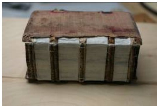
Nastavení vazů a připojení desek