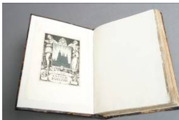
Přideštit s ex libris

Zlomky tisku z přideštit a ex libris nalepené k titulnímu listu byly sejmuty. Ex libris bylo nalepeno na novou předsádku. Předsádky byly vylepeny.