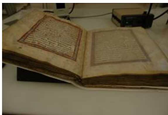
Stav po restaurování