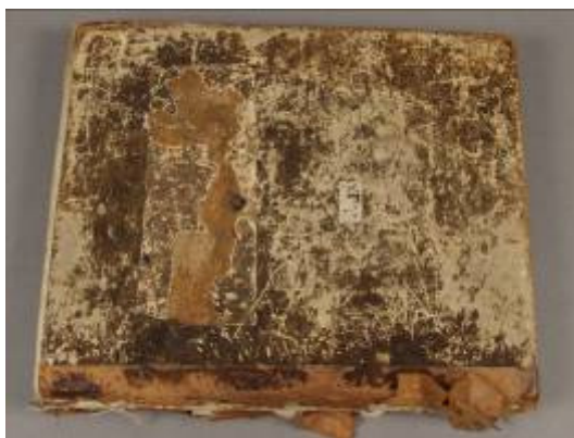
Stav před restaurováním

Nejprve byl sejmут novější potah hřbetu. Bohužel nebylo možné nadzdvihnout starší potah desek (jedná se o převazbu či úpravu původní vazby). Usoudili jsme tedy, opravit a použít rezavou useň.