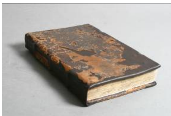
Stav po restaurování