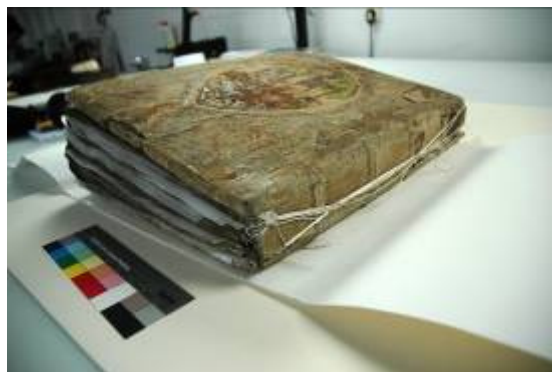
Stav před restaurováním