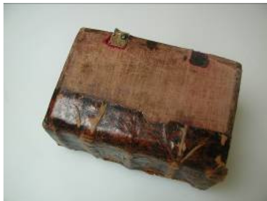
Stav před restaurováním