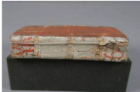
Stav před restaurováním