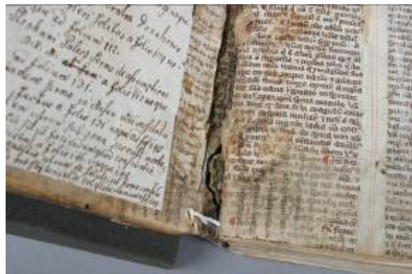
Stará oprava hedvábnou nití