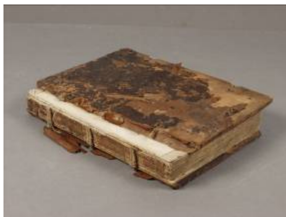
Stav před restaurováním

První 2 složky byly odšity a spraveny, stejně jako celý knižní blok a poslední listy. Zpřetrhané vazby byly navázány pomocí silnějších lněných nití, na ně byly přišity první složky a poslední listy s křídélky. Dodány byly také nové předsádky. Niti byly přilepeny do volného prostoru výžlabků v desce. Plynutý přechod vazů do desek byl zaplněn směsí dřevěných pilin a želatiny. Potah byl sejmut a celá přední deska, hřbet a hrana zadní desky byly potaženy novou hnědou teletinou. Fragmenty původního potahu byly aplikovány na novou useň.