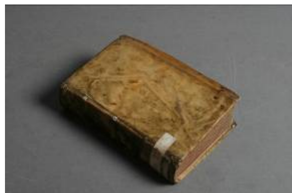
Stav po restaurování

Po nasazení desek a nalepení přelepů hřbetu, byly vazy protaženy pergamenovým potahem. Potah byl nalepen pouze na desky. Na vnitřní stranu přední desky byla zpět nalepena ex libris. Na závěr byly doplňky japonským papírem zaretušovány akvarelovými barvami.