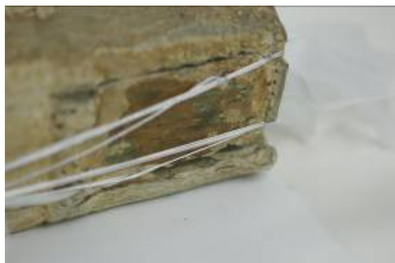
Detail přichycení složek