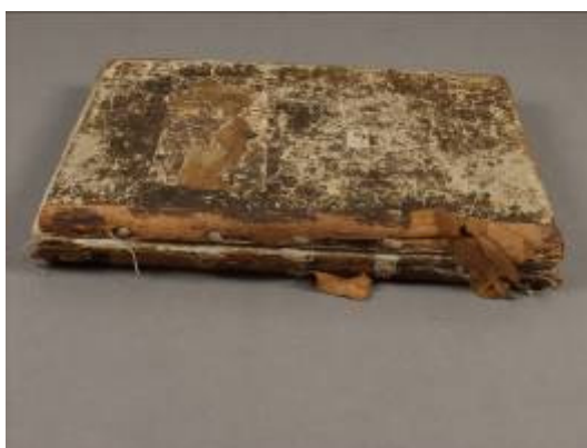
Částečně sejmутý hřbet

Vazy byly nastaveny bílou kůží, která byla přišita k vazům. Přitom bylo prvních 5 složek přišito (pův. šití bylo uvolněné). Kožené řemínky pak byly zastrčeny do zádlabů v deskách a zalepeny moukou.