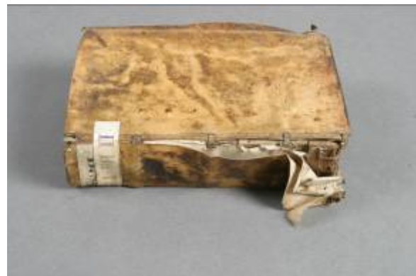
Natržený potah ve drážce

Knižní blok byl očištěn a spraven. Desky a potah byly sejmuty. Z předeštlí byla sejmuta 2 ex libris (nalepená přes sebe). Pergamenový potah byl zvlhčen v klimatizační komoře a vyrovnán. Poté byl potah vyspraven silnějším japonským papírem.