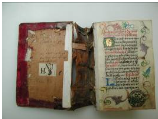
Stav po odlepení plátěného proužku