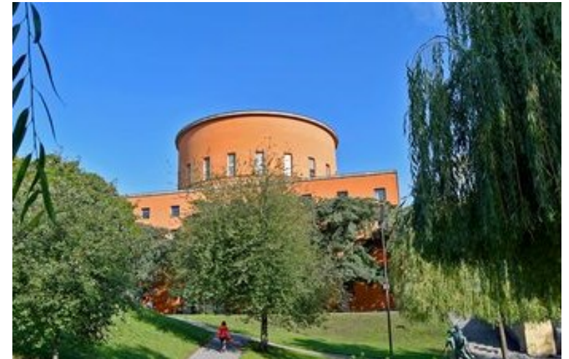
Budova Městské knihovny.