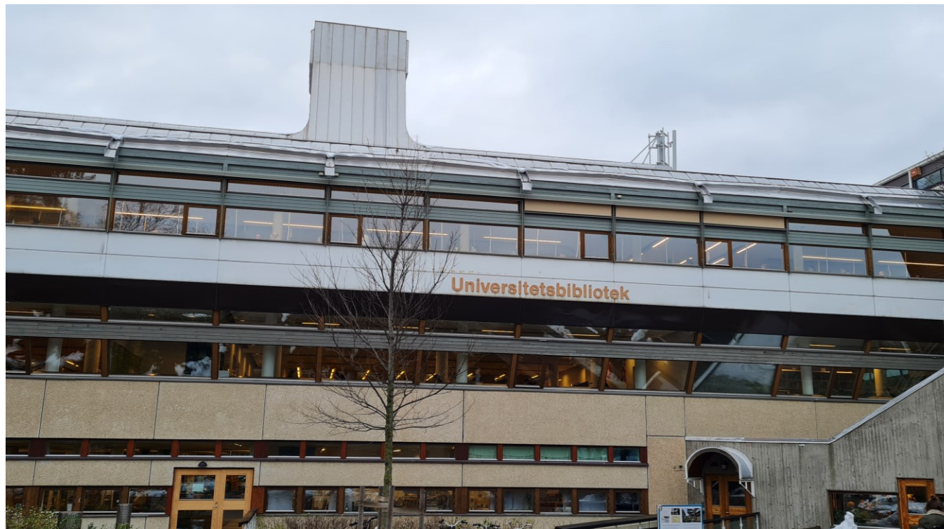
Budova univerzitní knihovny