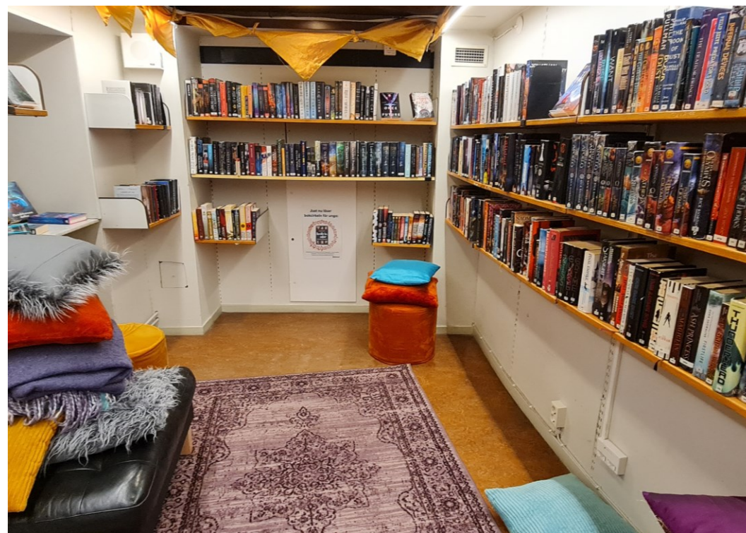
Oddělení pro mládež