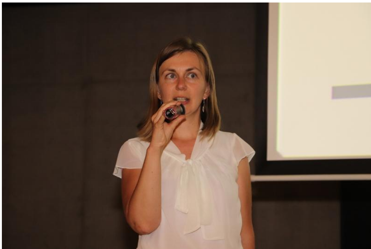
Autor prezentace, Název oddělení, Datum prezentace