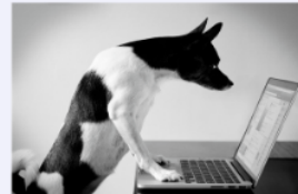
7 Clickbait Advertisements You Won't Believe! Just we won't tell you some online you click best right now. 2.7k Comments 13k Shares