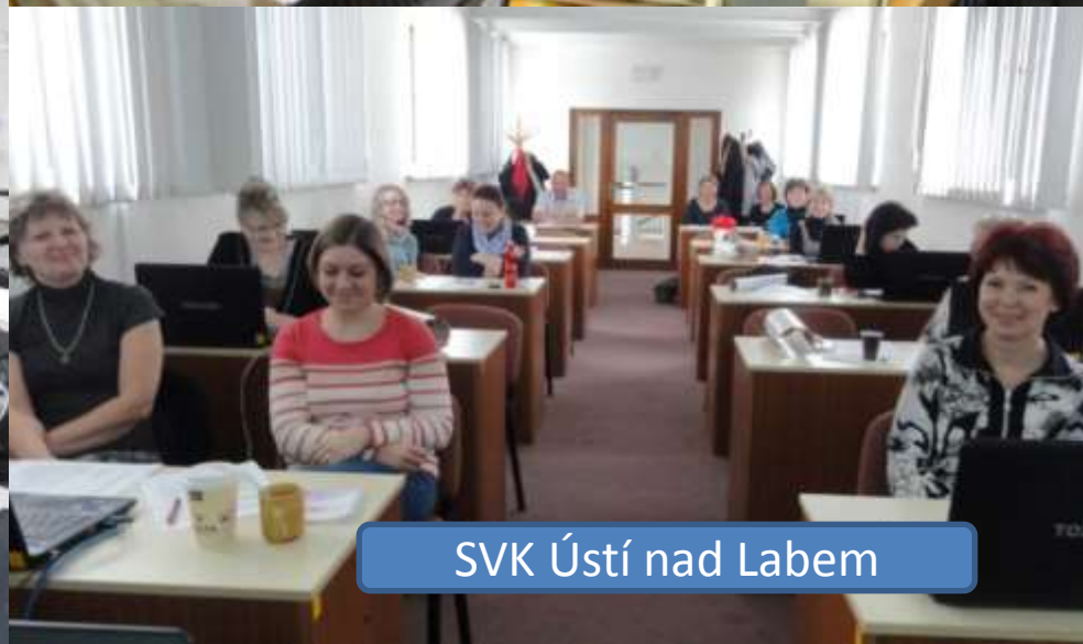
SVK Ústí nad Labem