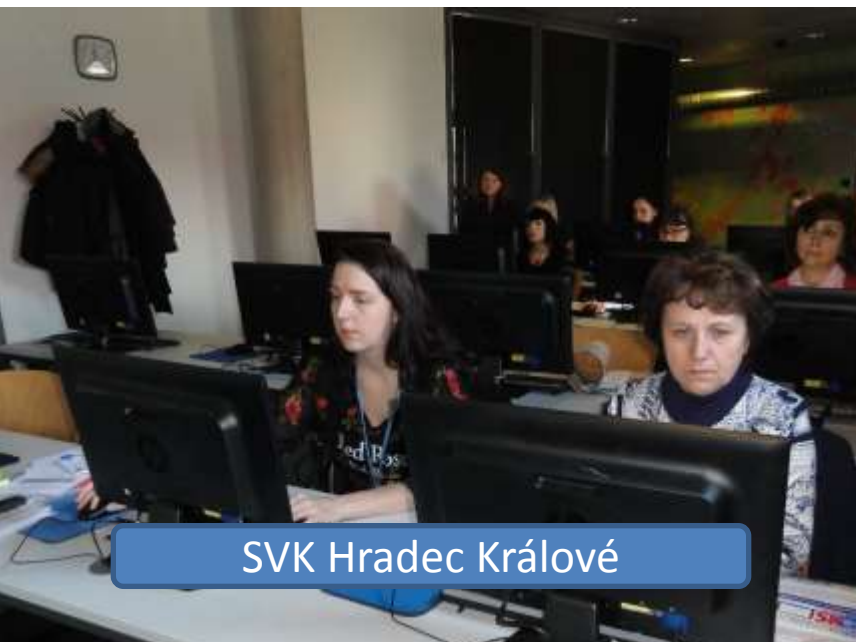
SVK Hradec Králové